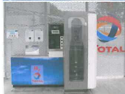
Brussels Ruisbroek 2008