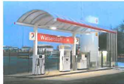
Berlin Heerstraße 2006