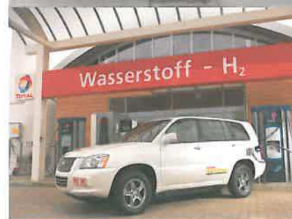
Berlin Holzmarktstraße 2010