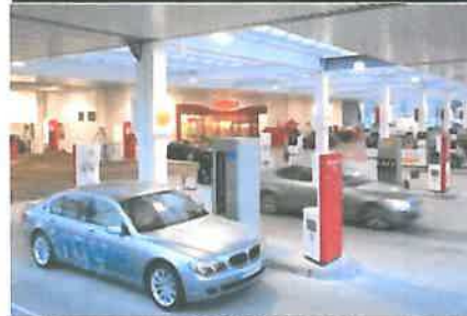
Munich Detmoldstraße 2007